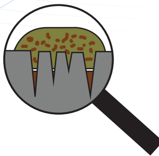
Zwilżanie powierzchni przy użyciu „klasycznych” produktów do czyszczenia